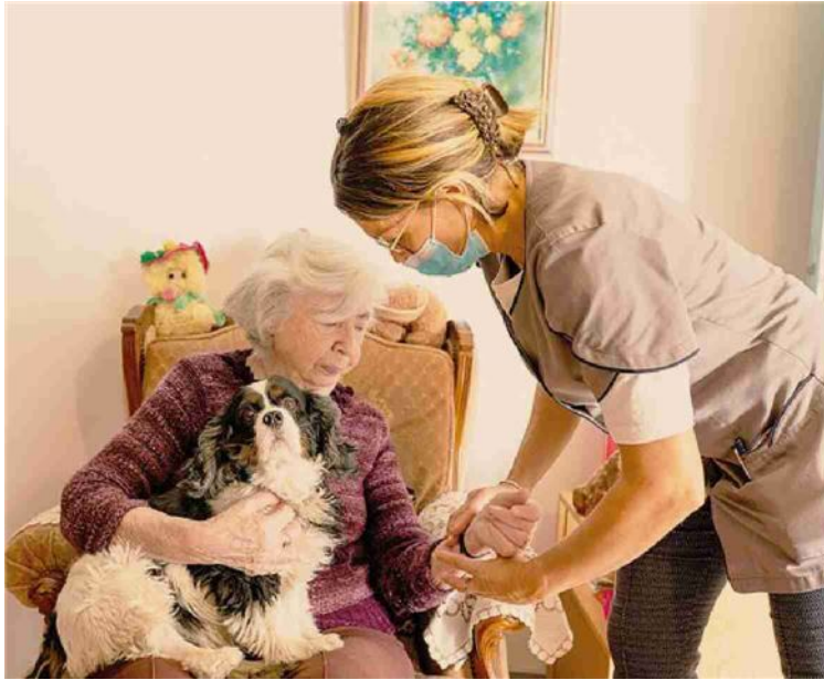
Colf e badanti. La riduzione dei contributi prevista dalla manovra non si applica ai lavori domestici